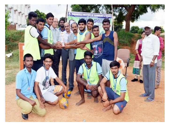
Volleyball (Men) Runners up – Dept.of EEE