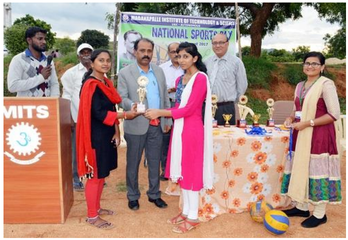
Shuttle Badminton (Girls)