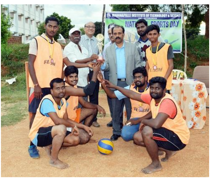
Volleyball (Men) Winners – MBA