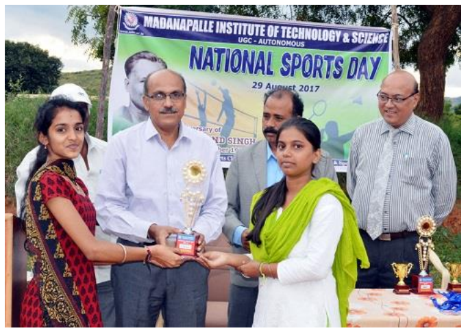
Shuttle Badminton (Girls)